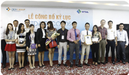
STDA 2A soạn ngôi vương của STDA 1A, nắm giữ "Siêu thị có doanh số bán hàng lớn nhất"

Đột phá với con số ấn tượng: Sáu tỷ chín trăm năm mươi chín triệu đồng, STDA 2A đã xuất sắc soạn ngôi vương của STDA 1A ở STDA Records lần thứ 4 để mang về chiếc cúp "STDA có doanh số bán hàng lớn nhất" tại STDA Records lần 5.