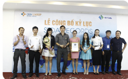
STDA 1B tiếp tục chiếm ngôi vương "Siêu thị có số lượng giao dịch nhiều nhất"